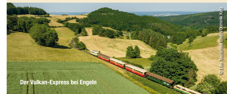
Der Vulkan-Express bei Engeln

Erweitern Sie ihre nostalgische Bahnreise durch das Brohltal zu einem erlebnisreichen Tag in der Vulkanregion Laacher See! Neben einem Besuch im Kloster Maria Laach locken das Vulkanmuseum Lava-Dome in Mendig sowie die benachbarte Vulkan-Brauerei. Auch das märchenhafte Schloss Bürresheim oder der Geysir bei Andernach sind einen Besuch wert. Alle Ziele sind von unserem Bahnhof Engeln per Reisebus und auch mit dem ÖPNV bestens erreichbar. Ebenfalls empfehlen wir Ihnen die Einkehr in einem der bahnnahen Restaurants. Wir beraten Sie gerne!