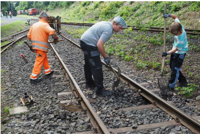
▲ Der AK Oberbau kümmerte sich mit altgedienten und neuen Mitstreitern um das Gleis 7 in Brohl. Per Hand und Maschine wurde das Gleis gerichtet und gestopft.

Los ging es schon am Vormittag: Die Arbeitskreise Oberbau und Technik hatten praktische Tätigkeiten aus ihrem Arbeitsumfeld vorbereitet, um einen anschaulichen Einblick zu bieten. In Gleis 7 hat das Team um Frank Muth die Gleislage gerichtet und mit einer kleinen Stopfmaschine bearbeitet. Und auch in der Werkstatt wurde fleißig gewerkelt. So wurde der Wagen 33 darauf vorbereitet, wieder auf seine Drehgestelle abgesenkt zu werden. Ca. 15 Interessenten hatten sich eingefunden, Einige sind der IBS seither bereits beigetreten.