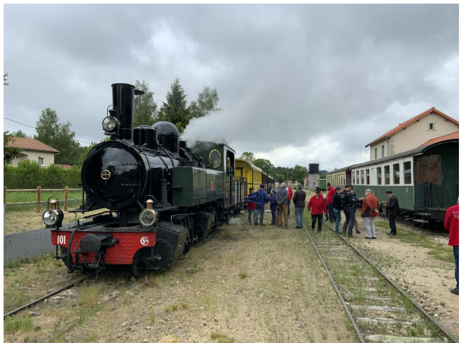
▲ Am Morgen des 28. Mai 2022 begann nach einem gemeinsamen Frühstück am Bahnhof Raucoules die Bahnreise mit dem „Velay-Express“. Lok 101 führte den Zug.

Hier hatten wir etwas Zeit um die Anlagen in Augenschein zu nehmen. Am Lokschuppen begrüßten wir das junge