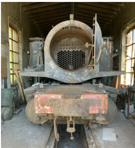
▲ Auf der Rückfahrt wurde im Bahnhof Tence ein längerer Zwischenstopp eingelegt, der u. a. zur Besichtigung der portugiesischen Mallet-Lok E 166, einer Schwesterlok unserer E 168, genutzt wurde.