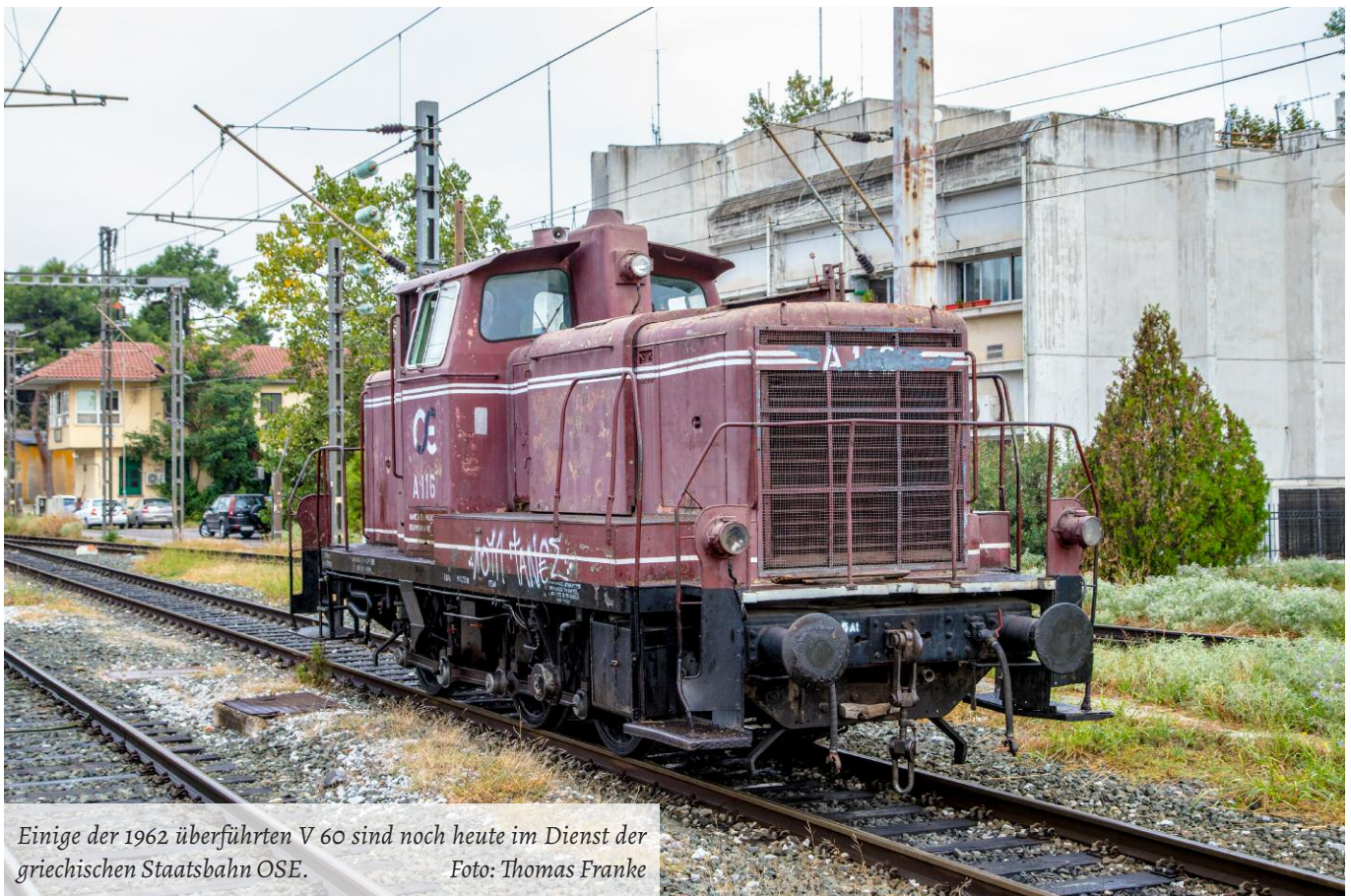
Einige der 1962 überführten V 60 sind noch heute im Dienst der griechischen Staatsbahn OSE.