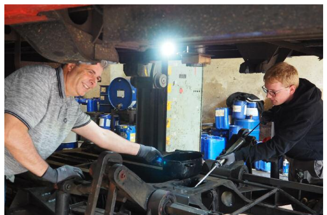
▲ In der Werkstatt wurde u. a. am Wagen 33 gearbeitet, der unter Leitung von Andreas Thiel nach erfolgter Hauptuntersuchung auf seine Drehgestelle abgesenkt wurde.