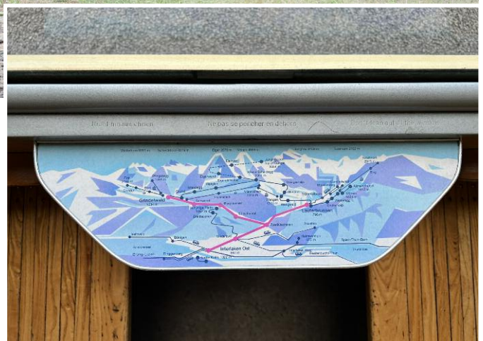
► Einzelne unserer BOB-Wagen haben bereits Karten auf den Tischen – allerdings noch solche, die die Reise aufs Jungfrauojoch beschreiben. Im Rahmen eines neuen Projekts sollen nun alle Wagen mit Karten des Brohltals ausgestattet werden.