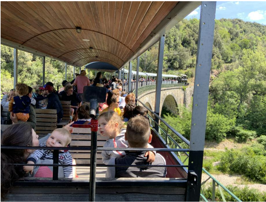
▲ Der lange Zug bestand fast ausschließlich aus offenen Aussichtswagen, die einen guten Blick auf die einzigartige Landschaft ermöglichen.