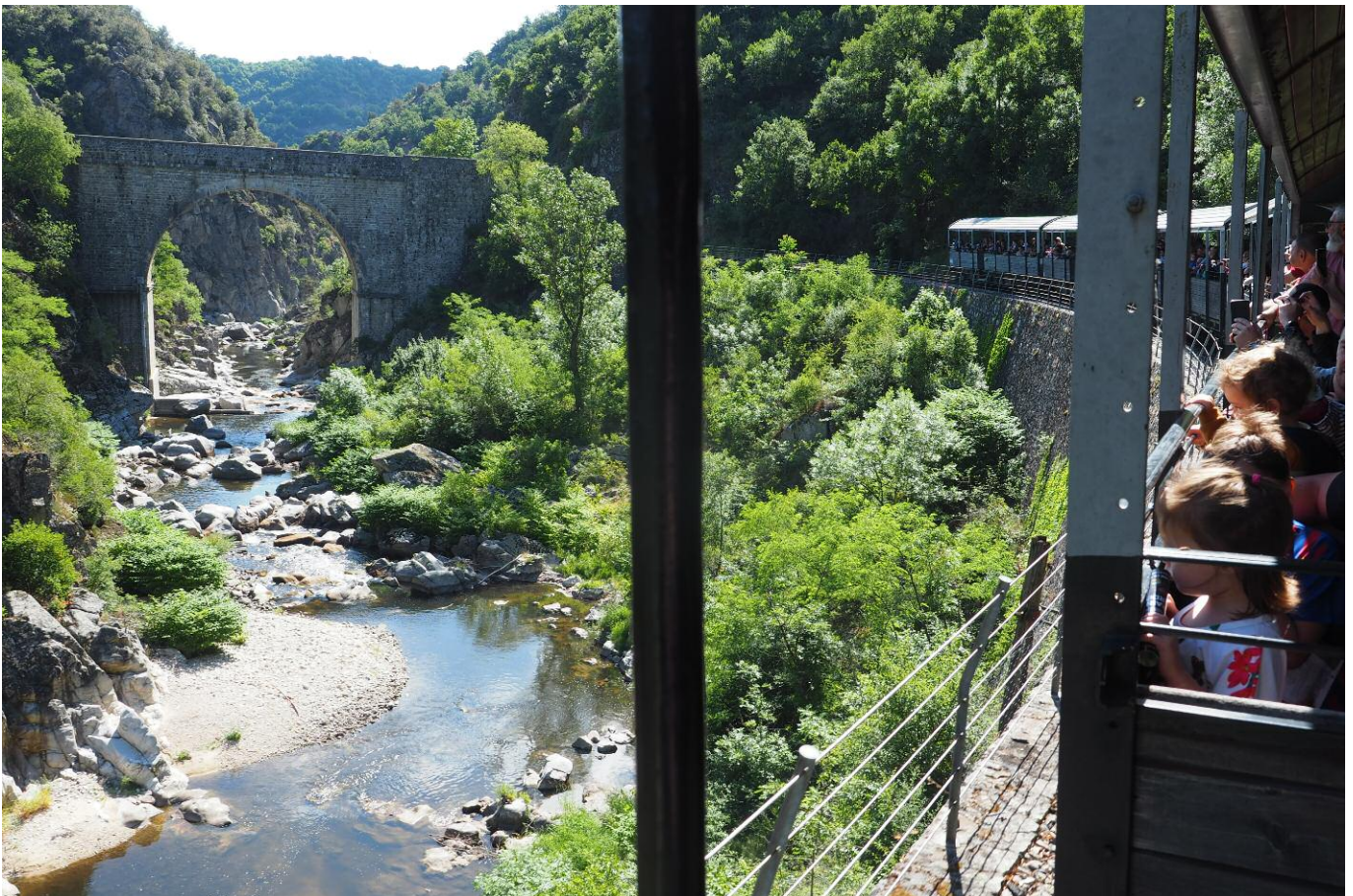
▲ Die Fahrt führte durch die beeindruckenden Schluchten des Doux.

Im Vorfeld waren wir überrascht, warum wir ins in Tournon treffen sollten, wollten wir doch eigentlich zum Velay-Express. Das ergab sich dann am nächsten Tag, als wir vom neugebauten Bahnhof Tournon-St. Jean de Muzols mit dem „Train des Gorges“ des „Train