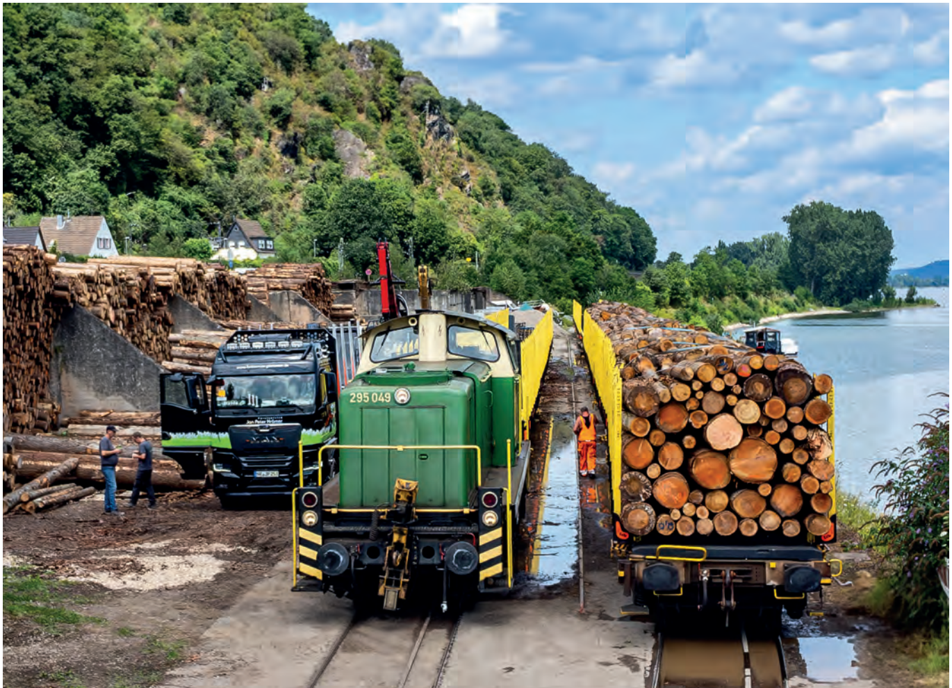
▲ Regel Verkehr herrschte am 22. Juli 2024 auf der Brohler Hafenspurbahn als in mehreren Fuhren im Hafen verladenes Stammholz auf Normalspurwagen abgeholt und im Umladebahnhof zu einem Ganzzug zusammengestellt wurde.

Eisenbahn als übergeordnetes öffentliches Interesse bewertet um Kapazitäten für künftige Nutzungen zu erhalten. Entwidmungen dürfen damit nur noch in begründeten Ausnahmefällen für ebenfalls im übergeordneten öffentlichen Interesse stehende Nutzungen umgesetzt werden. Wohnbebauung gehört allerdings nicht dazu.