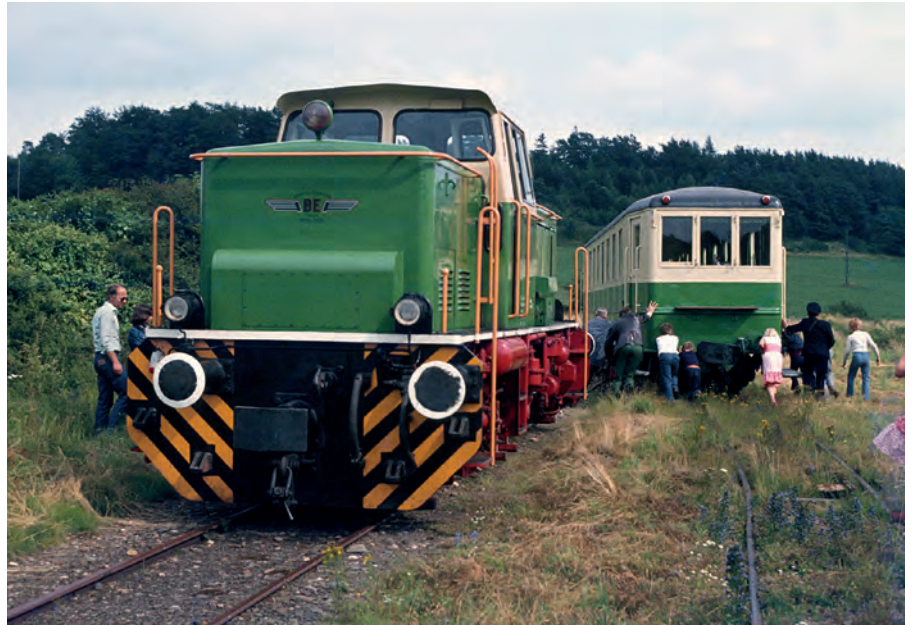
▲ Bei besetztem Nebengleis wurde in der Anfangszeit des „Vulkan-Express“ in Engeln mitunter auch per Muskelkraft (auch der Fahrgäste!) rangiert: Mit vereinten Kräften wurde der VB50 wieder über die Weiche geschoben um ihn für die Rückfahrt wieder ankuppeln zu können, hier zu sehen am 22. Juli 1977.

Auch heute noch ist Engeln der Endpunkt der Brohltalbahn. Aus dem einst einsam gelegenen Bahnhof ist inzwischen ein ebenso belebter wie beliebter Ausflugsort für Touristen und Wande-