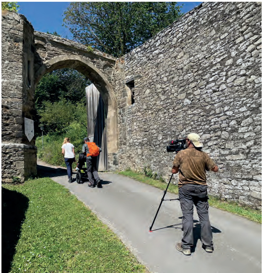
▲ Unsere Wanderer-Familie ist von Engeln über den Osteifelweg zur Burg Olbrück gewandert und wird dort von der Kamera schon erwartet.