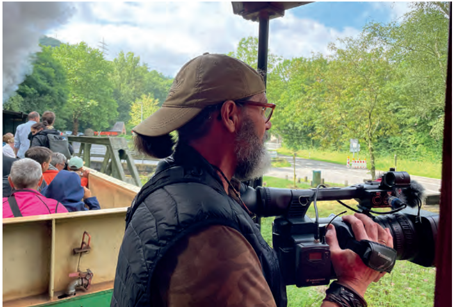
▲ Neben Außenaufnahmen wurden für den neuen Imagefilm insbesondere auch Sequenzen mit unseren Protagonisten während der Fahrt gedreht, hier im Bereich der Schweppenburg.