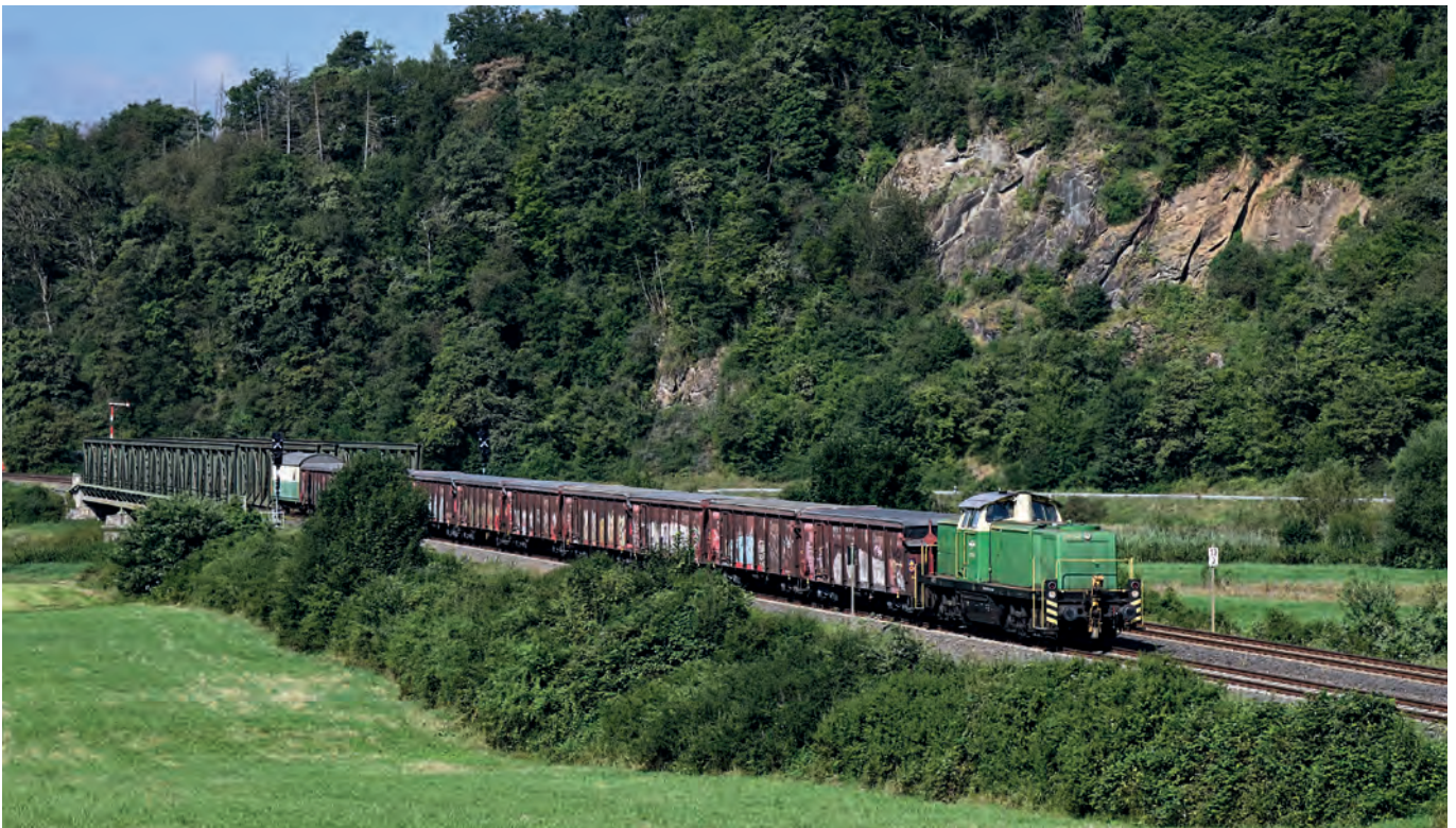
▲ Mit einem Tonzug ist 295 049 am 02. August 2024 auf der Lahntalbahn bei Leun-Stockhausen unterwegs. Aufgrund einer im Stellwerksumbau auf ESTW begründeten Sperrung konnte DB Cargo diese Züge mangels Ressourcen nicht selbst fahren, so dass wir eingesprungen sind und die Züge nach Wetzlar gefahren haben.

Wie in Heft 2 / 2024 beschrieben, endete im Mai die Verladung von Ton und Holz im ehemaligen Rasselstein-Bahnhof in Neuwied. Hintergrund ist, dass der Geländeeigentümer ASAS derzeit auf Drängen der Stadt Neuwied bestrebt ist, die Gleisanlagen stillzulegen und das Gelände entwidmen zu lassen. Spannend wird allerdings, ob die Entwidmung nach der im Dezember 2023 wirksam gewordenen Novelle des Allgemeinen Eisenbahn-Gesetzes überhaupt Aussicht auf Erfolg hat. Der Gesetzgeber hat die Nutzung von Bahnflächen für die