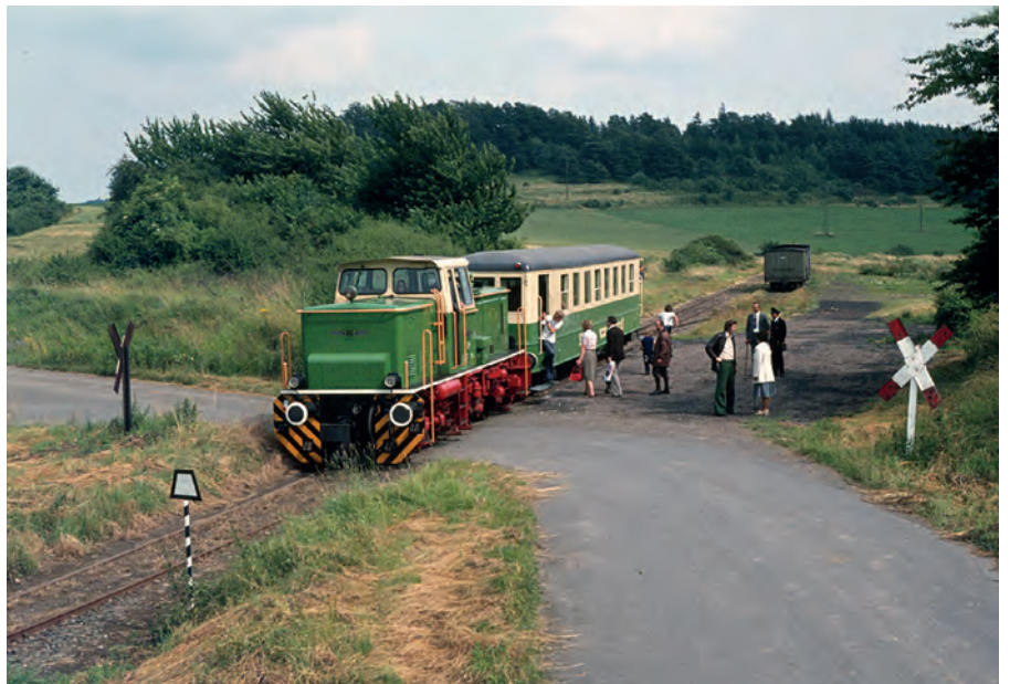
▲ Der kleine Zug steht am seinerzeit noch völlig „nackten“ Bahnhof Engeln zur Rückfahrt nach Brohl bereit.

rer geworden, die häufig auch als größere Gruppen anreisen. Mit der großzügig angelegten Vulkan-Stube ist Gastronomie eingerichtet worden und der benachbarte Geogarten vermittelt eher spielerisch Kenntnisse zur Erdschichte. Beim Kopfmachen braucht