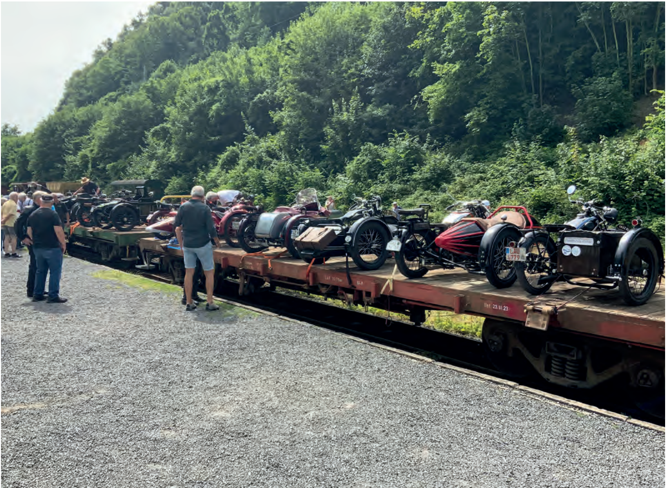
▲ Fertig verladen und verzurrt stehen 17 historische Motorradgespanne auf den Containerwagen zur Abfahrt nach Engeln bereit.