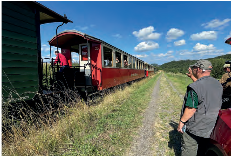
▲ Einzelne Streckenaufnahmen, wie hier an der Steilstrecke, konnten am Sonntag nachgeholt werden, nachdem das Wetter samstags zu einem Drehstopp zwang.