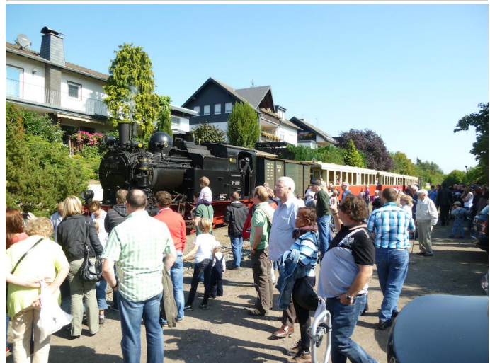
Der Vulkan-Expreß erreicht den Bahnhof Oberzissen, den Ausgangspunkt dieser Rundtour.