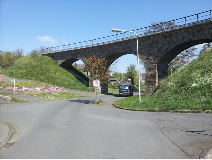
In Oberzissen unterqueren wir den Viadukt der Brohltalbahn.