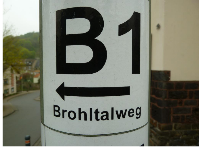
Wegemarkierung des Brohltalwegs von Hain zurück nach Oberzissen.