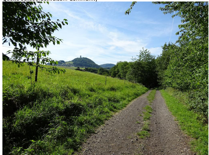
Am Brohlbachufer entlang wandern Sie nach Niederdürenbach - hier ergeben sich erste Blicke auf die Burg Olbrück.