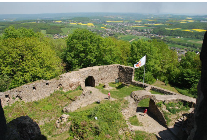
Burg Olbrück thront hoch über dem Brohltal und bietet beste Aussichten.