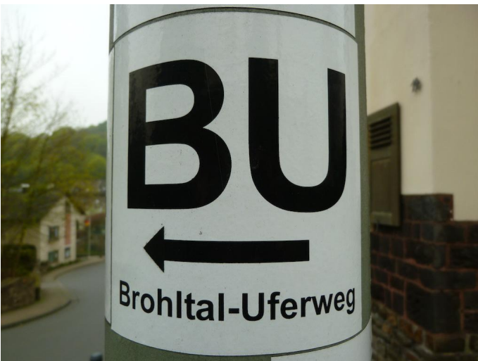
Wegemarkierung des Brohltal-Uferwegs von Oberzissen bis Niederdürenbach.