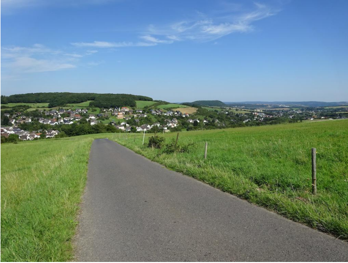
Blick zurück auf Niederdürenbach. Bald ist schon Hain erreicht.