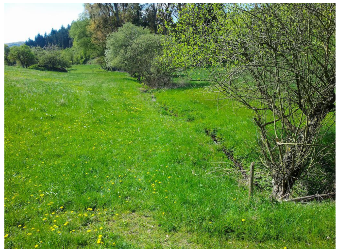
Nach dem Abstieg wird unterhalb von Hain der Quackenbach überquert.