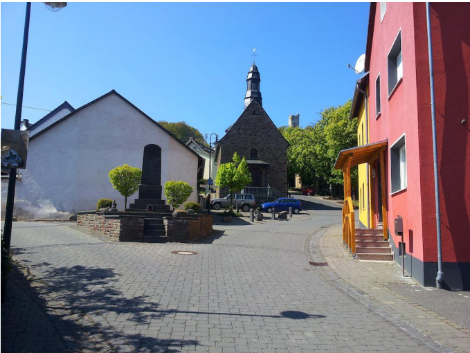
Nach dem Aufstieg erreichen wir die Kapelle in der Ortsmitte von Hain.