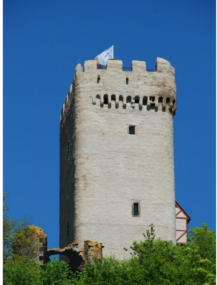
Der Bergfried von Burg Olbrück.