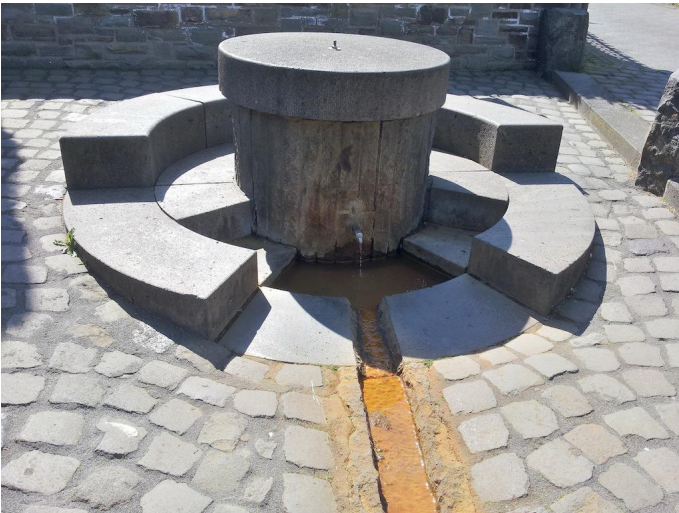
Kurz vor dem Ziel lohnt ein Zwischenstopp am Oberzissener Sauerbrunnen.