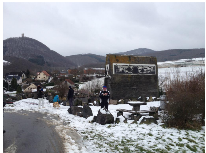
Zwischenstopp an der ehem. Nachspannstation der Seilbahn in Niederdürenbach.