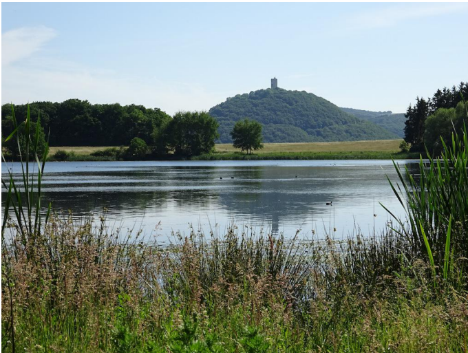
Burg Olbrück spiegelt sich im Rodder Maar - hier bei einer sommerlichen Tour.