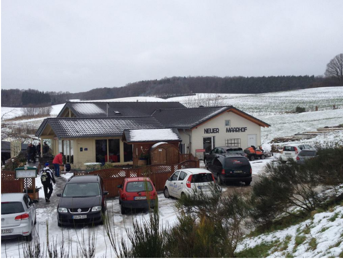
Vorbei am "Neuen Maarhof" geht es aufwärts zum Rodder Maar.