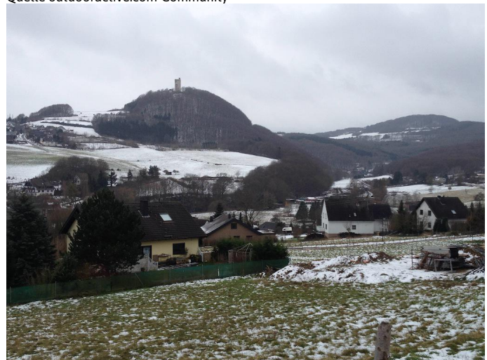
Blick auf die Burg Olbrück kurz vor Niederdürenbach.