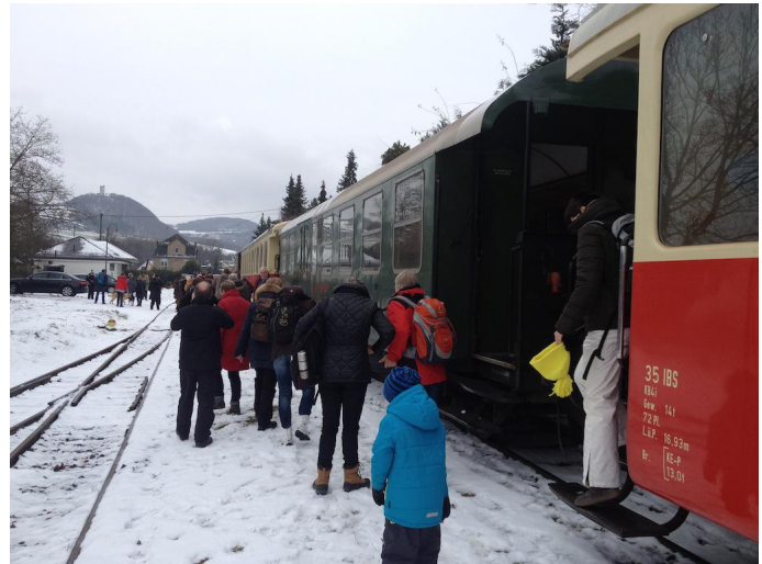
Ankunft mit dem Vulkan-Expreß zu einer Winterwanderung am Bahnhof Oberzissen.