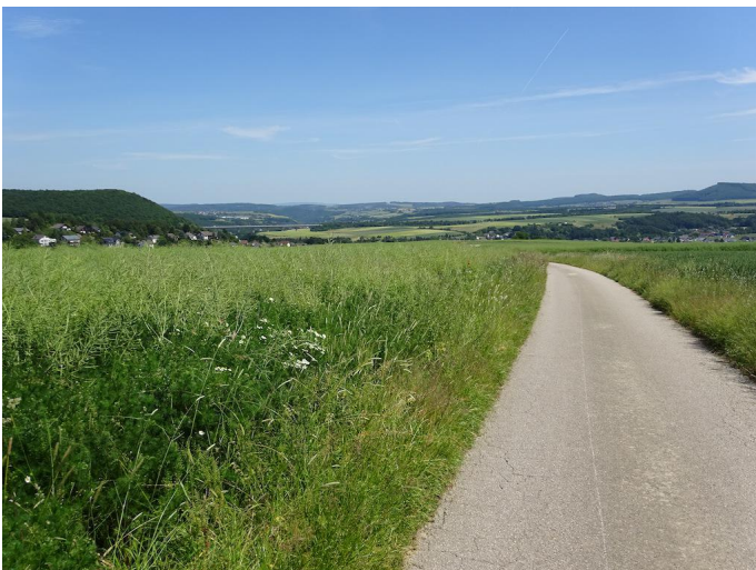
Blick vom "Brohltalblick" über das untere Brohltal.