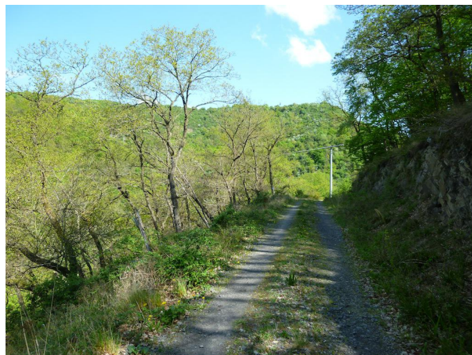
Auf halber Höhe über dem Brohltal geht es durch den Wald in Richtung Brohl.