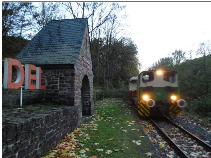
Ein Zug der Brohltalbahn erreicht den Haltepunkt Schweppenburg-Heilbrunnen.