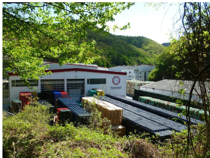
Am Wegesrand liegt der Tönissteiner Mineralbrunnen.