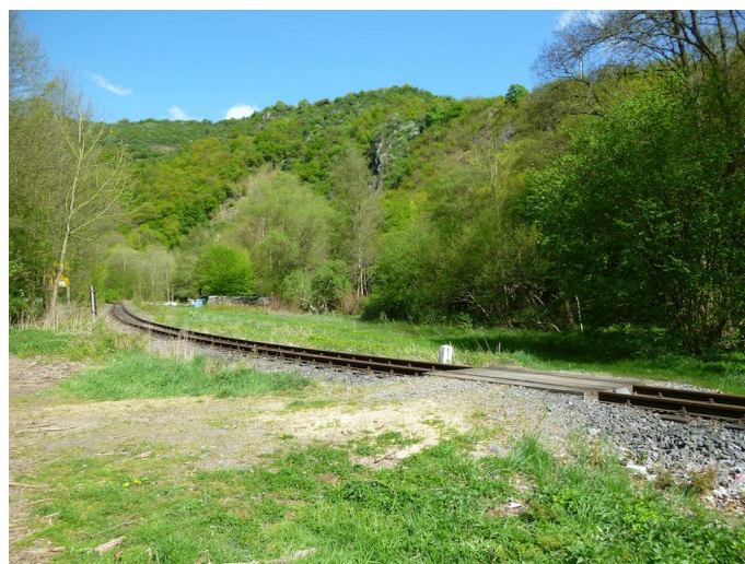
Überquerung der Brohltalbahn ca. 2 Kilometer vor Brohl.