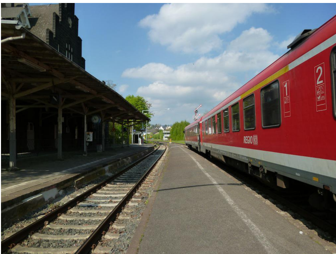
Am Ziel der Tour, am Bahnhof Mendig, werden die Züge der RB 92 nach Andernach und Mayen/Kaisersesch erreicht.