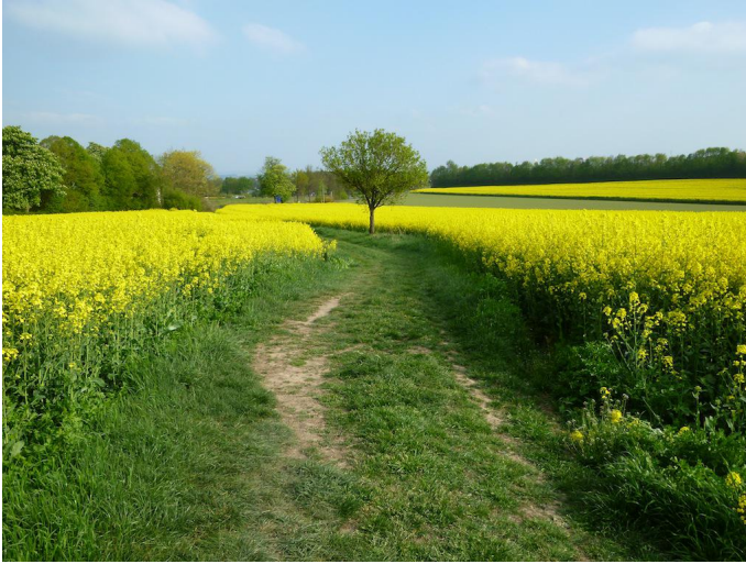
Durch die Felder geht es entlang der Laacher Mühle.