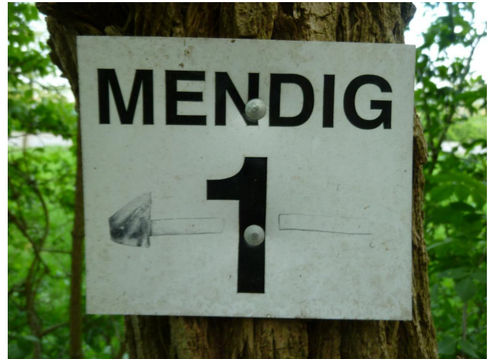
Wegemarkierung "Mendig 1" von Maria Laach nach Mendig