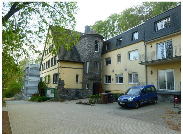
Vorbei am Naturfreundehaus geht es weiter in Richtung Mendig.