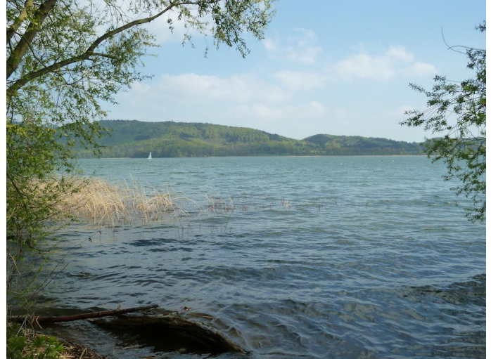
Am Ufer des Laacher Sees entlang führt der Weg nach Süden.