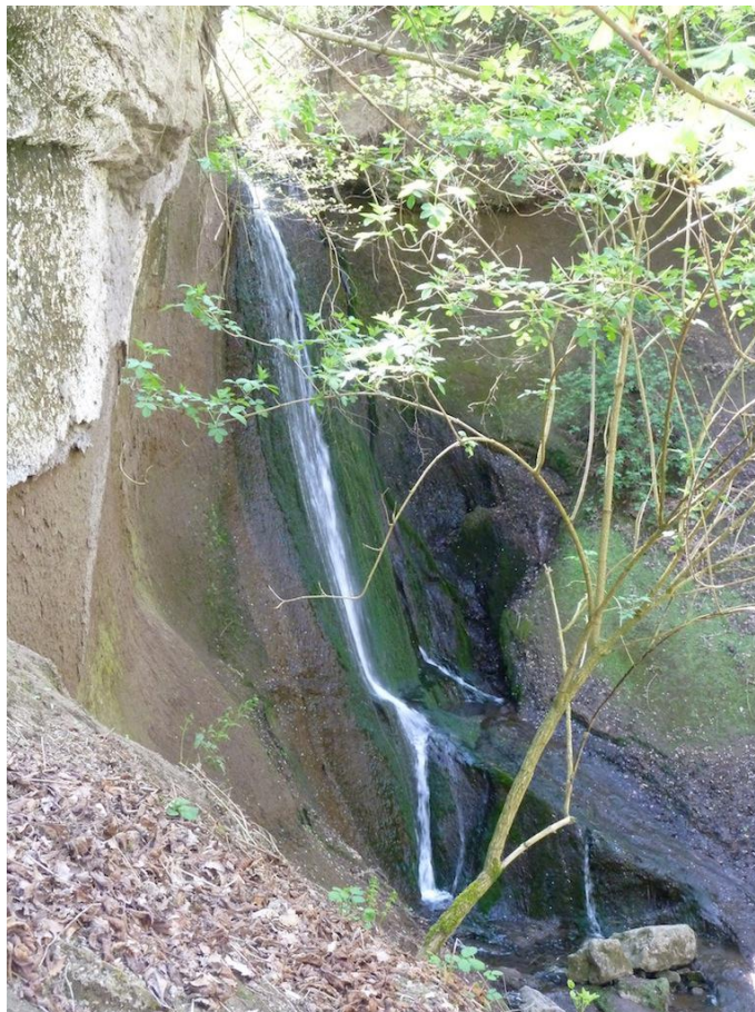
Ein Wasserfall markiert den Höhepunkt der Wolfsschlucht.