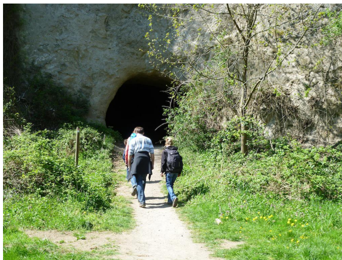
Der Weg führt direkt durch die Trasshöhlen.