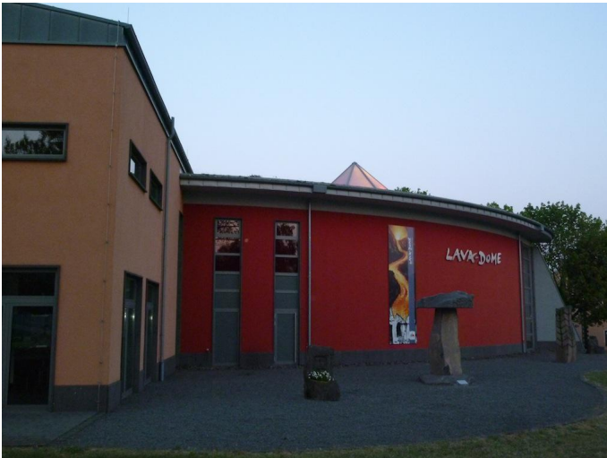
In Mendig befindet sich das Vulkanerlebniszentrum "Lava-Dome".