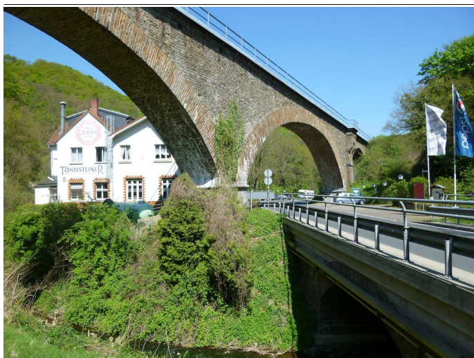
Unter dem Viadukt der Brohltalbahn geht es los in Richtung Trasshöhlen