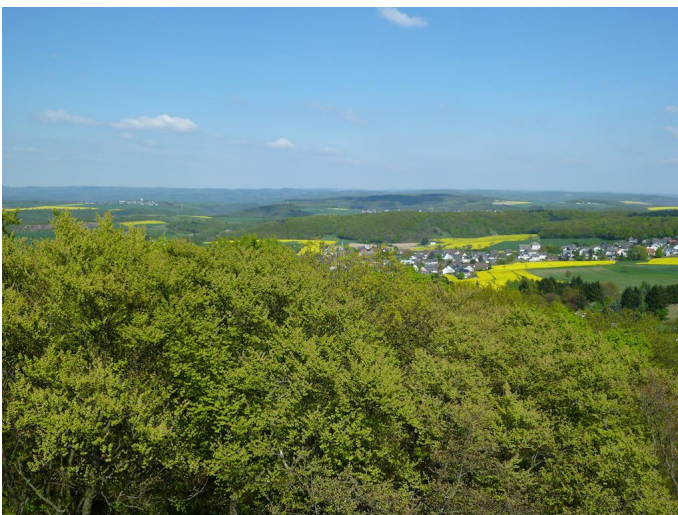
Blick vom Lydiaturm über das untere Brohltal. Autor Michael Hergarten Quelle outdooractive.com-Community