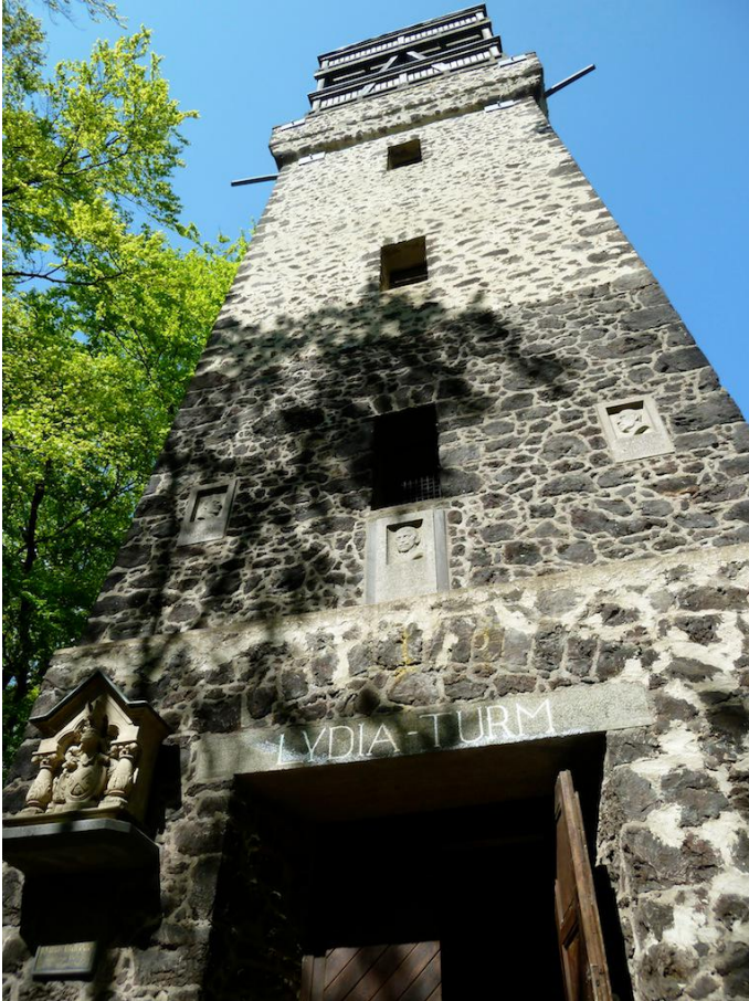
Am Lydiaturm bei Wassenach ist der höchste Punkt der Route erreicht.