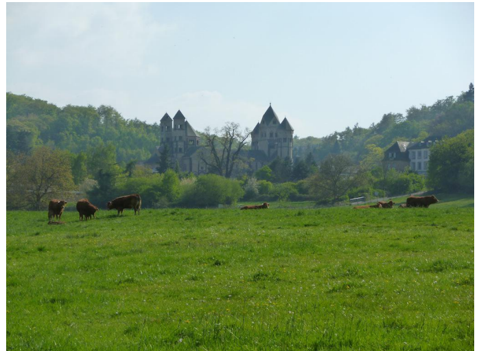
Am Kloster Maria Laach bietet sich ein Zwischenstopp an.