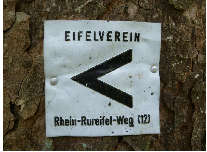
Wegemarkierung Rhein-Rureifel-Weg (bis Maria Laach)